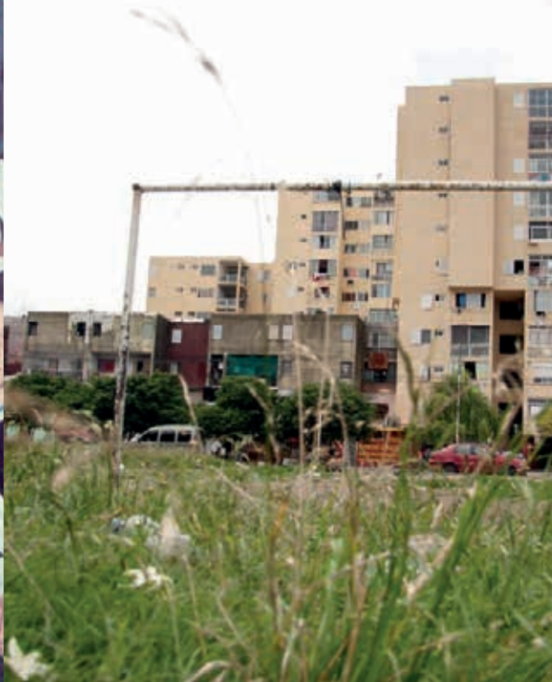
✦ El nudo 1 y una de las primeras canchas donde jugaron Carlitos y Cabañas.

el bufet de paredes rosas, sirve café en vasos de telgopor.