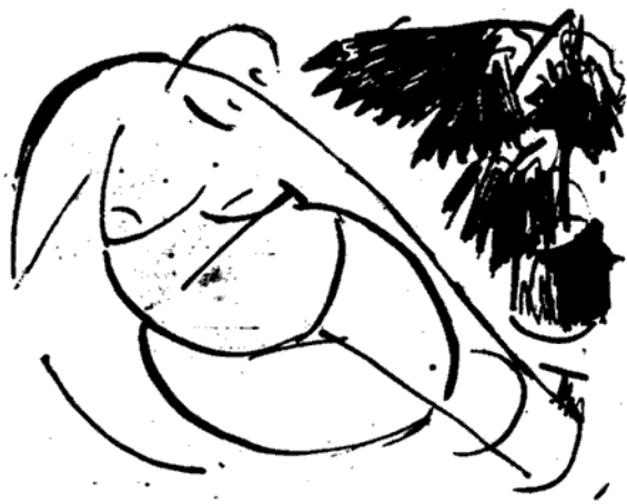
Vladimir Tatlin (c. 1911-1913): Desnudo reclinado

Frente al encadenamiento sin fin, frente al alud, sólo queda la definición personal. Para muchos la historia no ha terminado. De allí nace la esperanza. El todavía acabará con el arribo de los instrumentos de la razón. El cuando ya es hijo de ese pasado que justifica y a la vez cancela el anhelo democrático. Disposición al estremecimiento, o culto a la primera deidad. La democracia como energía que invade e incomoda, o aceptar plácidamente la conducción. Aceptación del inamovible veredicto sobre vencedores y vencidos que pronuncie el sufragio, o la componenda que todo lo oscurece. Democracia del hogar hasta Palacio, o silenciosa aprobación de los actos autoritarios, pequeños y grandes. Sana y mítica intransigencia, o relativismo que borra los rumbos. Asumir la total responsabilidad de la conducción nacional, o permitir que las advertencias delimiten espacios. Democracia hoy, o acatamiento del sacrificio.