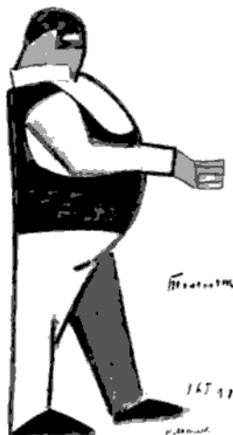
Kazimir Malevich, 1916: Victoria sobre el sol. El grande

Algo destaca en esta amenazante sencillez, una coincidencia es clara: la valoración del juego electoral . Qué mejor para el país que el hecho de que se enaltezcan los canales legales y no se proponga su violación como medio para el cambio. Se desprecia la política a la mexicana, pero se levanta a la urna como nuevo gran símbolo de convicción nacional. En muchos sentidos la sencillez democrática es un impulso que hace tabla rasa de las grandes concepciones del mundo y su interpretación. Las invocaciones dogmáticas tienden a ser desplazadas. La sencillez democrática de México de alguna manera se inscribe en esta modalidad generalizada en varios partidos políticos europeos. Democracia es libertad de expresión y organización, transparencia en todos los procesos electorales del país. Es respeto a la victoria de la mayoría, así la diferencia sea de un voto. El voto secreto no