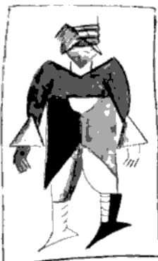
8 Victoria sobre el sol. El nuevo