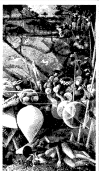
Deambulación bedonista (detalle)

La XIV Asamblea Nacional culminó con un discurso del Presidente de la República: Salinas de Gortari ratificó su militancia priista. El tono polémico y apasionado fue propio de un líder político ante sus correligionarios. Todo sistema presidencialista es dual y por ello contradictorio: el jefe de Estado debe gobernar para todos al mismo tiempo que ejerce un liderazgo sobre el partido al que pertenece. La democracia implica la separación de papeles: líder de partido en el partido, jefe de Estado en el palacio. Las elecciones de 1991 demandan, más que nunca, que el presidente asuma todas sus responsabilidades como jefe de Estado. Por una feliz paradoja éste es el mejor servicio que le puede hacer al partido que encabeza.