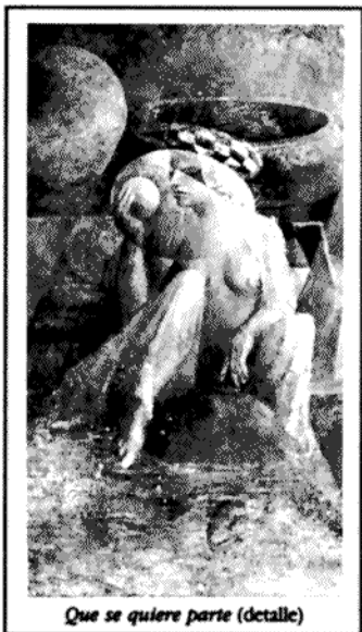
Que se quiere parte (detalle)

La última vez que lo vi, ya casi inmóvil y apenas alerta, veía un noticiero en el que pasaban una y otra vez la foto del cadáver de Caecescu. Mi abuelo logró sacar una mano asombrosamente vieja del habitual montón de cobijas que lo cubrían. La levantó poco a poco, apuntó el índice hacia la pantalla y lo movió tres veces con aire misterioso, mientras musitaba algo. Se tardó tanto en lograrlo que, cuando acabó, lo que había en la pantalla ya no era Caecescu, sino un anuncio de comida para perros. Y me hubiera gustado saber qué pensaba y qué sentía él al hacer ese gesto que delataba algo mucho más enigmático de lo que podía parecer a simple vista, pero ya no le quedaba voz.