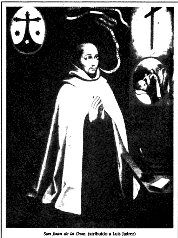
San Juan de la Cruz. (atribuido a Luis Juárez)

Dios..."; mientras que la imagen debe abandonarse "pues Dios no cae debajo de imagen ni forma".