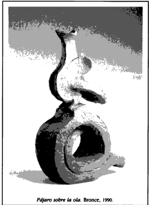
Pájaro sobre la ola. Bronce, 1990.

En México, ese mismo fenómeno ocurre de manera contradictoria. Por una parte, el programa de modernización del gobierno, y su definición como un liberalismo social, se inscribe en las tendencias universales que mencionamos arriba. Entre el nacionalismo revolucionario y el liberalismo social hay una enorme distancia. Con la reforma del Estado y el fin del discurso comisarial se reconoce el derecho a la alternancia.