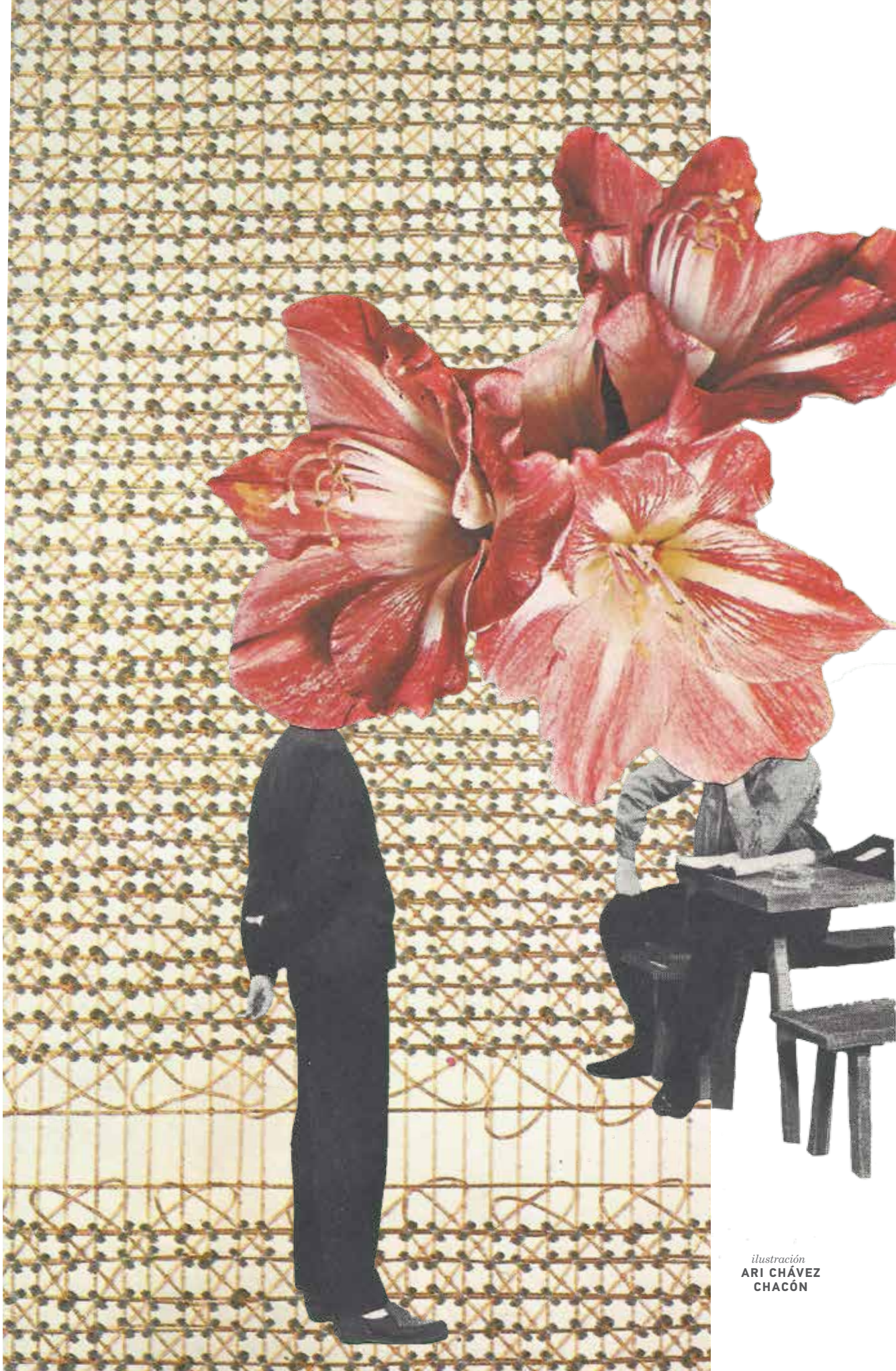
ilustración ARI CHÁVEZ CHACÓN