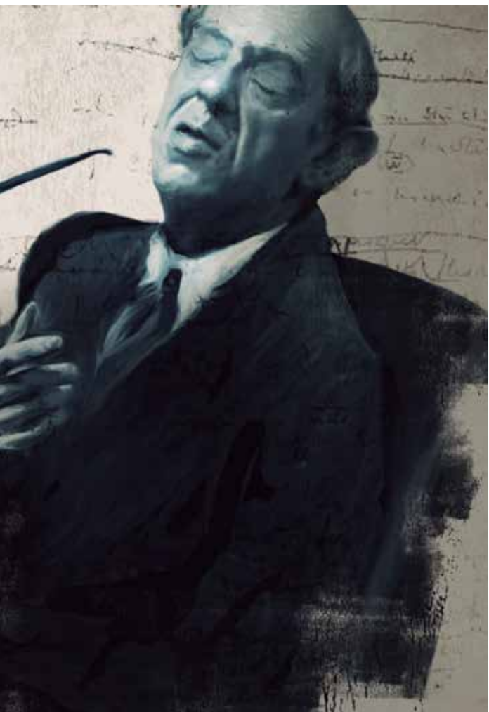
Ilustración: LETRAS LIBRES / Manuel Monroy

elocuentes y naturales en la prosa de Berlin. Ignatieff dice que estas conferencias son “un hito de la radio británica [y] en la propia vida de Berlin”. 6 Pero ¿cómo había llegado Berlin a este punto y a esta peculiar introspección? 7