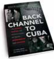
William M. LeoGrande, Peter Kornbluh BACK CHANNEL TO CUBA: THE HIDDEN HISTORY OF NEGOTIATIONS BETWEEN WASHINGTON AND HAVANA Chapel Hill, University of North Carolina Press, 2014, 544 pp.

Cuban revelations se ocupa principalmente de la economía cubana en los últimos veinte años. Arranca con un breve pero intenso retrato de Fidel Castro en el ejercicio del poder absoluto: de 1994 a agosto de 2006, cuando una severa enfermedad limitó su participación en el gobierno. En 1993, con la desaparición de la Unión Soviética y la pérdida del subsidio (65 mil millones de dólares entre 1960 y 1990, 40% en préstamo, el resto un regalo), Cuba sufrió un colapso económico cuyos efectos no tenían precedente. Frank no deja de registrar algunos: huesos rotos operados sin anestesia, remate de los últimos y exiguos tesoros de las familias (libros, joyas), desaparición de los productos más necesarios (jabón, cerillos, toallas sanitarias) y el retorno de la prostitución abierta. Lo que siguió fue el “período especial en tiempos de paz”, eufemismo que implicó un