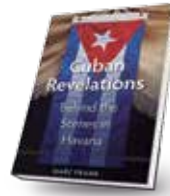
Marc Frank CUBAN REVELATIONS: BEHIND THE SCENES IN HAVANA Gainesville, University Press of Florida, 2013, 326 pp.