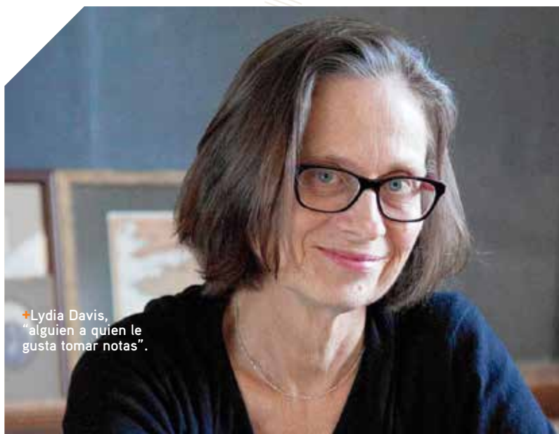
• Lydia Davis, “alguien a quien le gusta tomar notas”.

No sabía que mi uso de la ironía fuera característico. No creo que sea irónico o paradójico que muchas frases de Proust sean tan largas (muchas, no todas) y las mías tan cortas. Pero, aunque mis relatos ya eran breves cuando empecé a traducir a Proust, mientras hacía ese proyecto me propuse escribir los relatos más cortos que pudiera, con el requisito de que tuvieran cierta sustancia y solidez por breves que fueran.