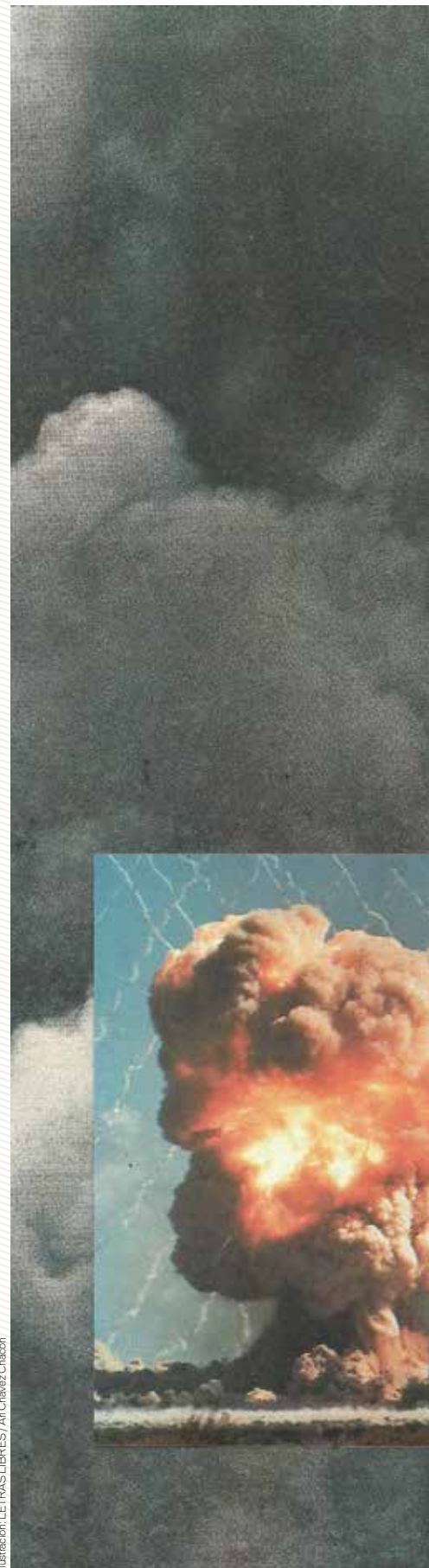
Ilustración: LETRAS LIBRES / Art Chavez Chacón

Revisé de un vistazo el piso de la regadera, no había señales de ningún