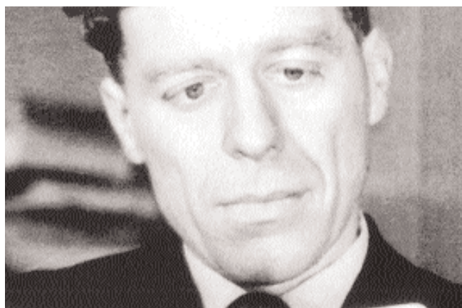
Emmanuel Mounier, 1905-1950.