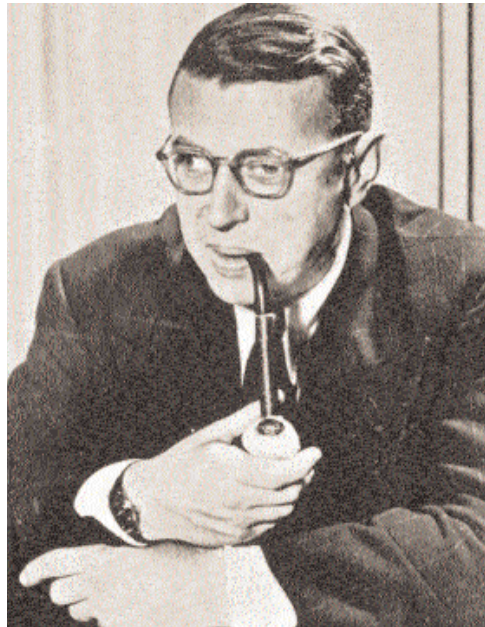
Jean-Paul Sartre, 1905-1980.