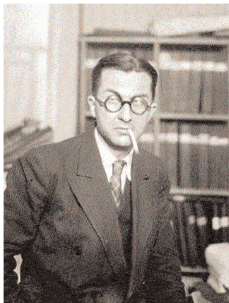
Paul Nizan, 1905-1940.

en pedagogos. Pero no universitarios, o de manera marginal. Dos cosas los alejaban de la institución: la constricción de las disciplinas, su cerrazón, y, desde entonces, esa impresión de dar vueltas en un lugar cerrado. Y luego, la sombría repetición de