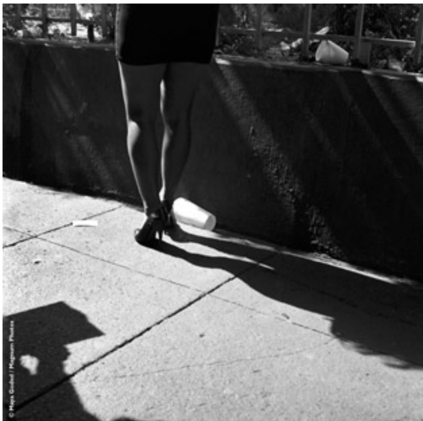
Maya Goded, Sin título , 1998, plata sobre gelatina.

También es sin duda esa distinción, que en español no es fácil de hacer —la que hay entre un desnudo y un “desvestimiento” (en inglés: nude y naked ), o, digamos, entre una pintura y una fotografía—, la que hizo pensar a las autoridades del Museo del Palacio de Bellas Artes que sería prudente colocar, en la puerta de la sala donde se presenta el trabajo de Maya Goded, la conocida recomendación: “Para mayores de 18 años.” No hay que ir muy lejos para dar con la demostración de que tal advertencia habría sido innecesaria si los cuerpos descubiertos que nos muestra Goded estuvieran pintados. Escaleras arriba, se presenta, sin ningún tipo de prólogo, la serie de dibujos y pinturas eróticas que Vlady realizó a lo largo