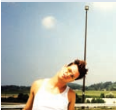
Jonathan Caouette en el documental sobre sí mismo.