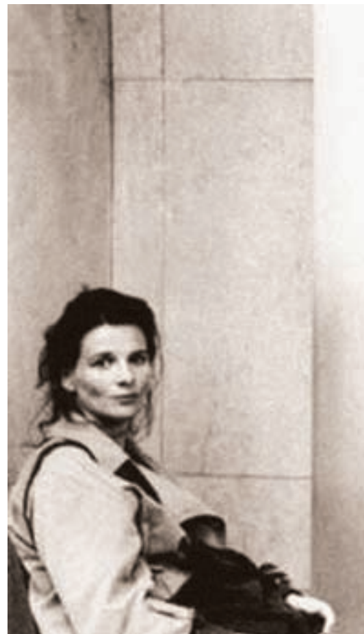
Juliette Binoche y Michael Haneke.

campo a orillas de un lago, una familia austriaca de clase alta —integrada por padre, madre, hijo y perro— recibe la visita de dos muchachos bien parecidos que visten como golfistas; después de pedir unos huevos para cocinar, los muchachos comienzan a torturar física y anímicamente a la familia hasta que acaban matándola. Cuatro personajes convergen en una calle de París: una inmigrante rumana, un maestro de origen africano, una incipiente actriz francesa y el hermano menor de su marido fotógrafo, que cubre la guerra en Kosovo; a partir de ese instante sus historias, prologadas y clausuradas por niños sordomudos que juegan a expresar sentimientos, divergen pese a continuar unidas gracias a los lazos invisibles de la incomunicación. Una familia integrada por padre, madre y dos hijos llega a su casa de campo en medio de un holocausto global que nunca se explicita; luego de que el padre es asesinado por otra familia que usurpa la vivienda, la madre y sus dos hijos huyen a una estación de tren convertida en microcosmos social, refugio de una especie en vías de extinción. En respuesta al David Lynch de Lost Highway , el presentador de un programa literario empieza a recibir videos anónimos en los que él y su familia aparecen grabados desde la calle; a los videos se suman dibujos oscuros, provocadores, que trastornan la esfera hogareña. Dos escritores distantes en el tiempo, Franz Kafka y Elfriede Jelinek, revelan en sendas adaptaciones filmicas