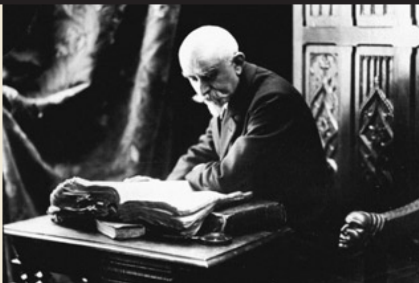
Joris-Karl Huysmans, decadente arrepentido, en su único (y raro) estudio fotográfico.

a Émile Zola y a sus amigos, Huysmans divide al naturalismo desde la derecha y se lleva al bando enemigo buena parte de los códigos confidenciales y los planos secretos de la escuela, armas y bagaje. Por el lado de Huysmans se van agregando los peores: los ultramontanos, los antisemitas, los anti-dreyfussards , quienes formarían en el siguiente siglo la Acción Francesa y los Camelots du Roi. Pero Huysmans rebrotará en la izquierda: en el Antoine Roquentin de La náusea (1938).