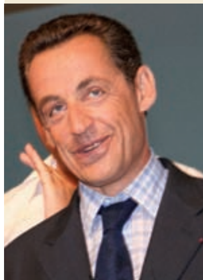
A la conquista del liderazgo europeo.

Cuando los coches ardían, Sarkozy comprendió que, más allá de la unión con el resto de Europa, el gobierno necesitaba un nuevo color si quería evitar un estallido de mayores dimensiones. Entendió que él mismo era la sangre renovada de la Francia. Sarkozy, como Napoleón, tiene grandeza; uno