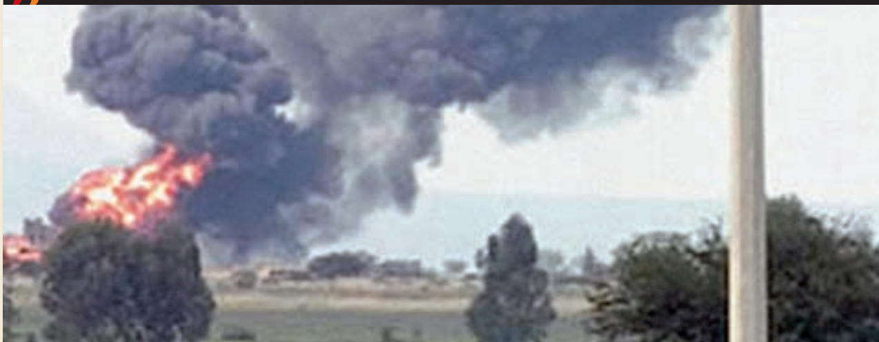
Ducto en llamas en el estado de Guanajuato.

En este sentido, el país ha visto cómo las opciones extrainstitucionales, como la guerrilla, se han venido incorporando paulatinamente a la lucha institucional en los últimos años. Por ello sorprende que todavía haya grupos que recurran a la violencia para hacer valer sus demandas. Desde luego, no faltará quien diga que las acciones violentas son sólo el reflejo de un México injusto y que mientras no se resuelva la honda desigualdad, tales fenómenos van a prevalecer. Los ataques a Pemex pueden tener una explicación sociológica, y, si es cierto que el autor fue el llamado Ejército Popular Revolucionario, se refieren también a la situación de inestabilidad en Oaxaca y, al parecer, a la presunta desaparición de dos miembros de esa organización delictiva. Pero ello no significa, desde luego, que los atentados tengan legitimidad.