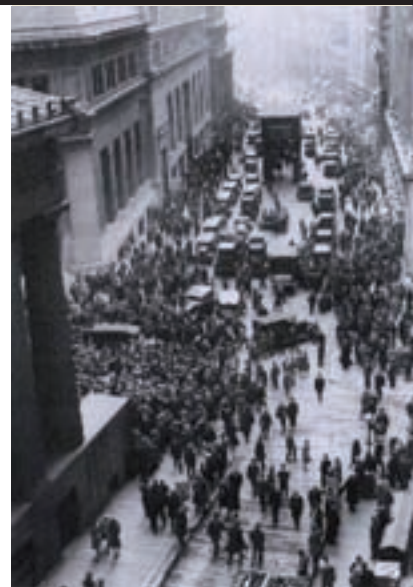
Imagen de Wall Street el Jueves Negro de 1929.

Lo que nadie explica y lo que nadie entiende es que una crisis producida en Estados Unidos, bajo sus propios cánones y afectándolo sólo a él, siga poniendo en jaque a la economía mundial, cuando tanto ha cambiado. Hoy el gigante norteamericano es un imperio en decadencia,