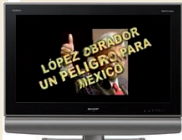
El fin de la guerra de los espots.

I. En primerísimo lugar, es absolutamente insostenible que la reforma se haya usado para decapitar al IFE y mermar su autonomía. El IFE era de los ciudadanos y no de los partidos, y la jerarquía política del país decidió retomar su control. ¿Cómo?