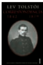
Lev Tolstói Correspondencia, 1. 1842-1879 ibíd., 2005, 386 pp.