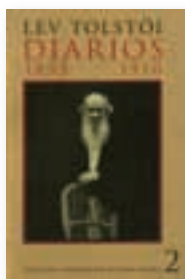
Lev Tolstói Diarios, 2. 1895-1910 ibíd., 2003, 482 pp.