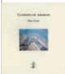
Elsa Cross Cuaderno de Amorgós México, Aldus, 2007, 61 pp.

La estructura del cuaderno es la forma que mejor le viene a los libros de poemas de Elsa Cross (ciudad de México, 1946). Por casual y transparente, pues no busca reelaborar las percepciones del poeta sino conservar su sencillez desnuda; por maleable y hospitalaria, ya que no entraña un guión escritural estricto —o, en todo caso, viajes, periodos y trances vitales disponen su vago proyecto—; es capaz de suscribir los meandros de lo inmediato, bosquejar el claroscuro del paisaje y conducir las divagaciones hacia el buen puerto de la reflexión. Las travesías físicas y las experiencias místicas —precipitada enunciación de los principales rasgos de su poesía— suelen confinarse al vuelo en la libreta que el peregrino lleva siempre a mano, presta a abrirse sobre variados escritorios: la barandilla del mirador, una mesa de café o las rodillas.