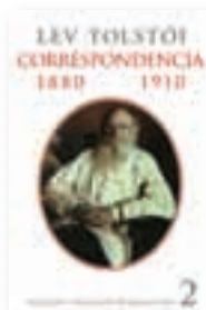
Lev Tolstói Correspondencia, 2. 1880-1910 ibíd., 2007, 363 pp.

Una historia que está por escribirse, o por lo menos yo no he dado con ella, es la historia privada de la novela rusa en Occidente, la narración de cómo y por qué Dostoievski y Tolstói cambiaron el mundo. Poetas-profetas que venían de un inmenso país desconocido, los grandes rusos lograron describir la vida misma al grado de confundirse con ella (el elogio mil veces repetido en honor de Tolstói) o de eternizar (como Dostoievski) las pre-