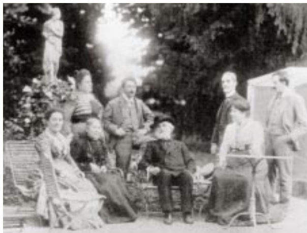
Verdi y amigos en su jardín de Sant'Agata.

en punta de lanza de la modernidad italiana del cambio de siglo. Todo esto sin dejar de gustar y sin dejar de ser popular, sin dejar de ser accesible y tarareable. Visto así, a un siglo de distancia, la proeza verdiana no se halla tan lejos de las gambetas del Pelussa : ambos, a su manera y a sus tiempos, van solos contra lo establecido, vulneran esquemas y convenciones sin dejar de atraer; ambos son centro y eje; ambos aparecen cuando el lenguaje de sus disciplinas luce agotado y trillado, cuando se venera la consistencia y no la chispa imprevista; ambos conservan el balón cuanto les place y lo ceden sólo