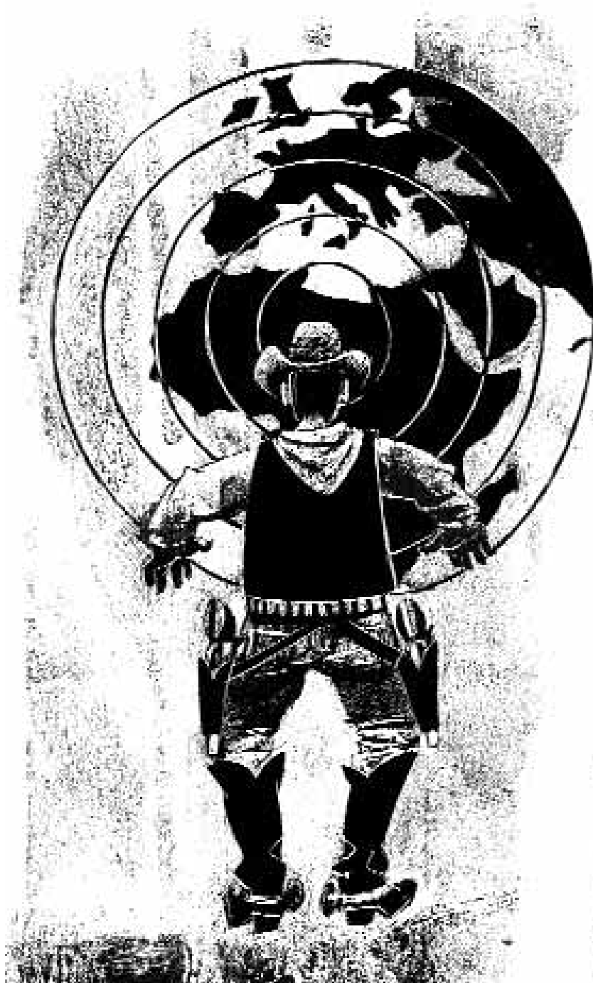
Ilustraciones: LETRAS LIBRES / Fabricio Vanden Broeck

PK: Lo que me preocupa es que contribuya a una especie de arrogancia: "Somos el ombligo del mundo." Es como cuando