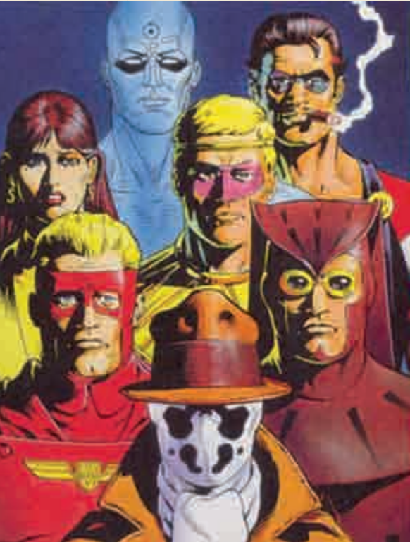
Watchmen o los custodios.

1985 ficticio, hace una deconstrucción multirreferencial del subgénero de los superhéroes y lleva las posibilidades de la narrativa gráfica a niveles de complejidad, temáticos y formales pocas veces vistos antes y después. En sus viñetas lo mismo se alude a las Tijuana Bibles (cómic porno de los años treinta) que a canciones de Bob Dylan o la obra de William Burroughs.