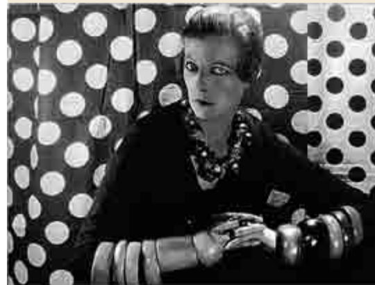
Nancy Cunard (1896-1965).