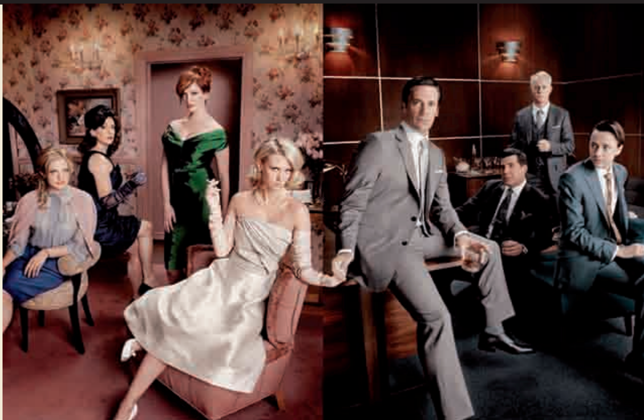
Reparto de Mad Men , con Don Draper en primer plano.

Library al ahora súbitamente hot y cool Yates. Las dos primeras han sido recientemente publicadas por Alfaguara con los títulos de Vía revolucionaria y Las hermanas Grimes , el tercero fue publicado hace unos años por Emecé Argentina, y yo ya tengo todos por separado. Pero hay un placer raro en comprarse libros que ya se tienen. Y el prólogo de Richard Price justifica la inversión. Allí se lee: “El territorio de Yates se ubica ligeramente al sur de Cheever, al oeste de O’Hara, al este de Carver y al norte de Tobias Wolff y Richard Ford”. Price cuenta cómo conoció al entonces perdedor y olvidado Yates y lo define así: “Se nutría de rencores, era una incubadora de desaires. Sus dioses personales eran Hemingway y Fitzgerald. Estaba amargado. Tenía todo el derecho del mundo para estar amargado. Estaba realmente amargado”.