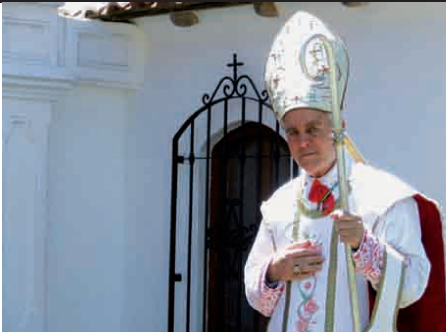
El obispo Richard Williamson.

Ciertamente hay negadores de la Shoá famosos, como Roger Garaudy, Mahmud Ahmadineyad, Pat Buchanan o Jean-Marie Le Pen, pero ninguno de ellos tan célebre como el obispo de la ultraconservadora Fraternidad