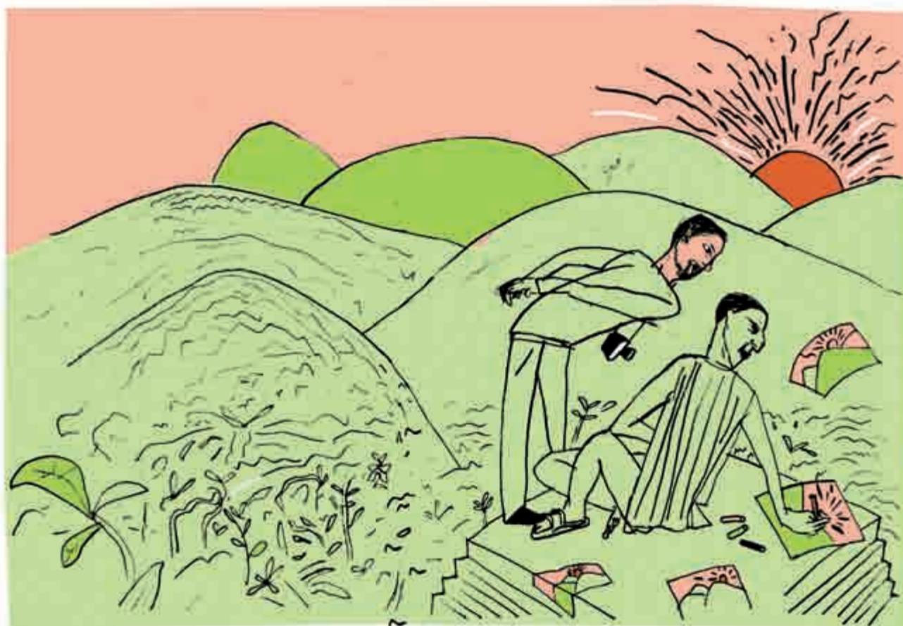
Ilustraciones: LETRAS LIBRES / Martín Kovensky