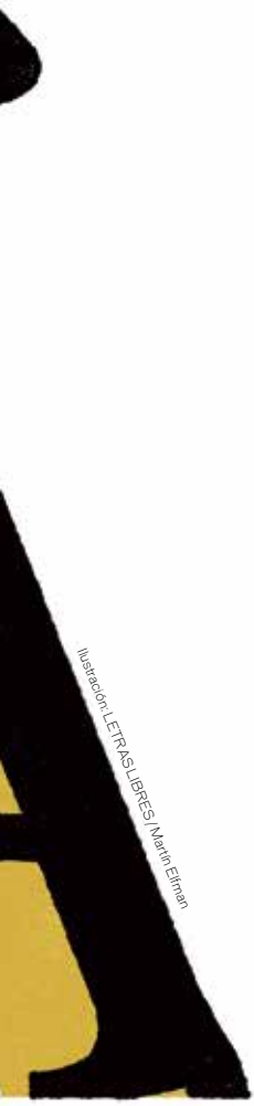
Ilustración: LETRAS LIBRES / Martín Elman