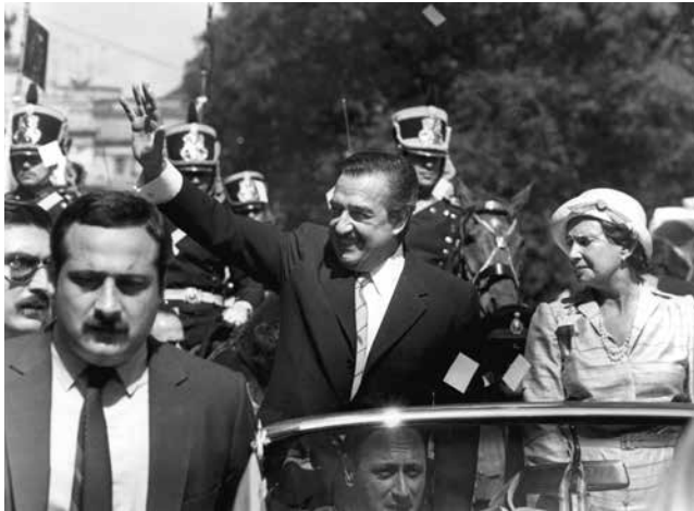
Fotografía: Toma de posesión de Raúl Alfonsín en 1983.