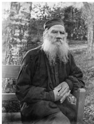
Fotografía: Lev Tolstói. Wikimedia Commons

La oposición al comunismo al otro lado del telón de acero cobró una nueva dimensión a raíz de la difusión en Checoslovaquia, en enero de 1977, de la llamada Carta 77 , en la que 242 intelectuales protestaban por la violación de los derechos humanos por el Estado checoslovaco. Uno de ellos, el dramaturgo Václav Havel, no tardó en convertirse en su imagen pública, muy distinta, por cierto, de la