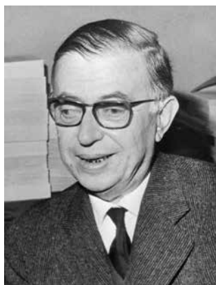
Fotografía: Jean-Paul Sartre. Wikimedia Commons

La carrera espacial será, junto al átomo, el gran impulsor de la presencia del científico en el imaginario de la Guerra Fría. La difusión que alcanzó la fotografía del físico Albert Einstein, tomada en 1951, sacando la lengua, con el pelo largo, canoso y despeinado, se explica por la especial receptividad social al mensaje que transmitía la imagen: la inteligencia más brillante y el comportamiento más estafalario. El físico alemán personifica también la diáspora de la intelligentsia europea, sobre todo judía, provocada por el nazismo en los años treinta, que tuvo Estados Unidos como destino final tras un breve paso por Francia o Gran