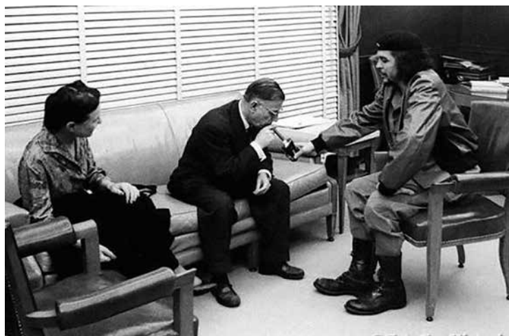
Fotografía: Ernesto Che Guevara reunido con Simone de Beauvoir y Jean-Paul Sartre, en Cuba. 1960.