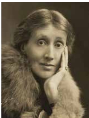
Fotografía: Virginia Woolf.

En su demonización por parte de la extrema derecha tuvo mucho que ver el papel que desempeñaron en la Revolución rusa, a cuyos principales protagonistas, empezando por Lenin, cabría considerar como intelectuales, tanto por su formación académica como por su labor