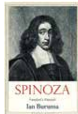
IAN BURUMA SPINOZA. FREEDOM'S MESSIAH New Haven y Londres, Yale University Press (serie Jewish Lives), 2024, 216 pp.

originarios de Portugal, que no habían perdido la nostalgia ni el idioma de España, de donde habían sido expulsados en 1492. Tampoco había menguado del todo su secreto apego a la fe judía, aunque sí la familiaridad con las fuentes y liturgias, que habían debido disimular para evitar, a menudo sin lograrlo, el juicio y aun la hoguera de la Inquisición. Esa larga postergación de una fe reprimida explica el celo que caracterizaba a la comunidad en la que creció Spinoza y en la cual su familia, por ambas ramas, tuvo un papel fundacional.