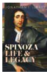
JONATHAN I. ISRAEL SPINOZA. LIFE AND LEGACY Oxford, Oxford University Press, 2023, 1344 pp.

La breve vida de Spinoza (1632-1677) parte de su origen y formación en uno de aquellos hogares de criptojudíos