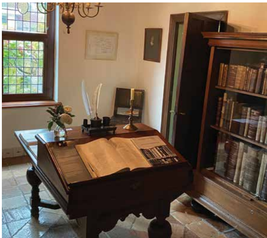
Casa-museo de Spinoza en Rijnsburg.

y modernos han compartido esa y otras dudas. En cualquier caso, la redención intelectual que propondría la Ética solo encontraría, en su tiempo, lectores secretos, devotos subrepticios.