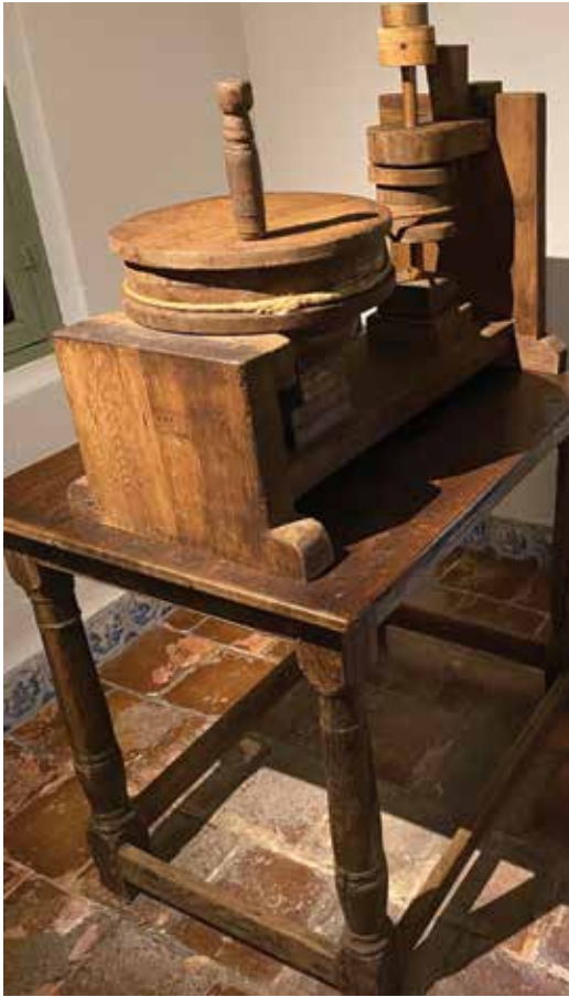
Máquina pulidora de lentes de Spinoza.