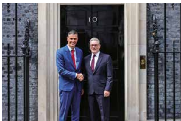
Keir Starmer y Pedro Sánchez, frente a la famosa puerta negra de Downing Street.